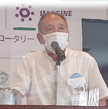
仁開ガバナー補佐による卓話。自身のロータリーモーメントをたっぷり語って頂きました。