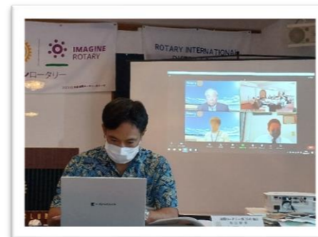
リモートでのご参加もありがとうございました。