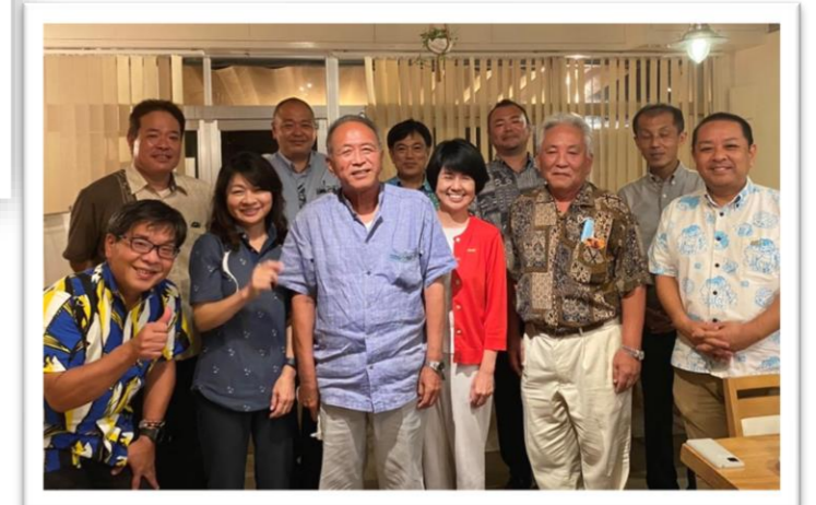
第1回会長幹事会 2022. 8. 26 IN 石垣島