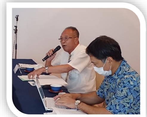
SAA はプログラム委員長