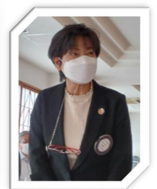
年の瀬も皆さまご健康で！

次回の卓話は、1/11(水)大宮小吹奏楽部 顧問の先生に、1/18(水)は浦添RC OGのラジオパーソナリティ