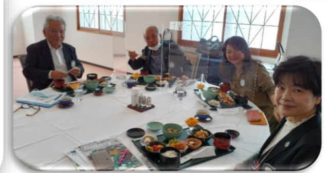
貴子社長からニコニコBOX