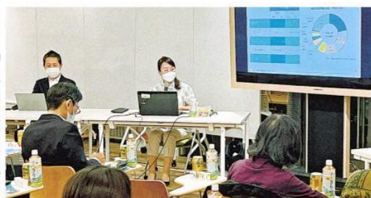
「サーキュラーエコノミー(循環型経済)」について考える参加者=2日、東京都千代田区・大手門タワー・ENEOSビル