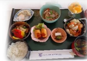
本日のロータリー膳。久しぶりに賑わった円卓で頂きました！