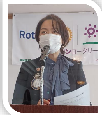
公共イメージUPのためのイベント