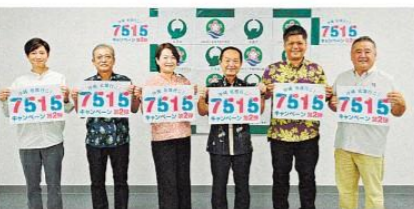
キャンペーンの利用を呼びかける関係者ら=11月30日、名護市産業支援センター

【名護】名護市と市観光協会は11月21日から、市内ホテルの宿泊が1人1泊最大5千円引きになるなどの特典を受けられる「7515」をスタートした。この3回接種がPCR検査などによる陰性証明の提示が必要。全国旅行支援との併用はできない。全国旅行支援が対象とならない、年末年始も同キャンペーンは利用可能。