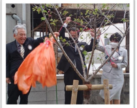
名護 RC よりサクラの贈呈をしました! 浦添で1番早く咲くサクラになる?!