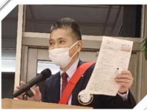
クラブ協議会から SAA を 務めていただきました