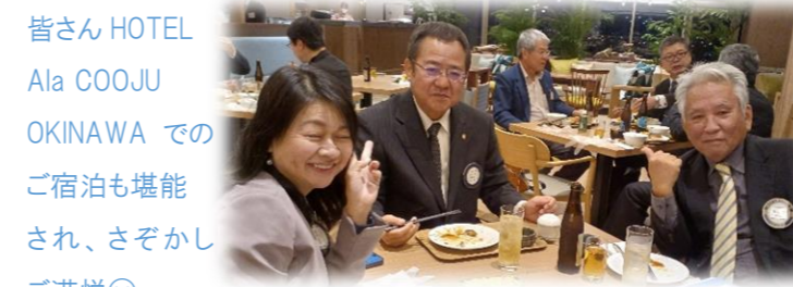
皆さん HOTEL Ala COOJU OKINAWA での ご宿泊も堪能 され、さぞかし ご満悦☺