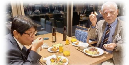
2次会は会長のご案内で