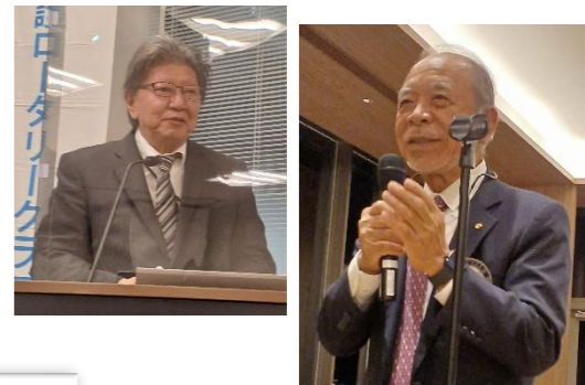
先輩方のお力で開催出来ました☆