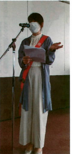
☆皆さんのコメントを拾ったのS.A.A.、さすがは町田副幹事☆