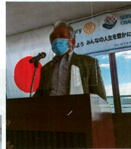
濱元エレク、会長不在の中 大役をお疲れさまでした！