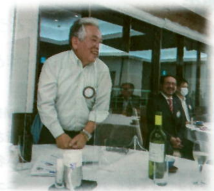
元気でゴルフに参加したい！ と、演元 IM 実行委員長