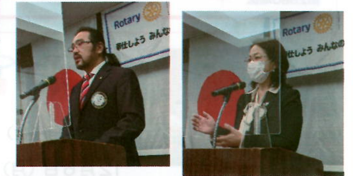
IM までもうひと踏ん張りです 会長・幹事！！