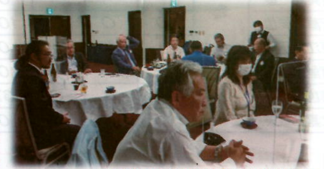
しばらくは 8 階の【北山】が会場となります