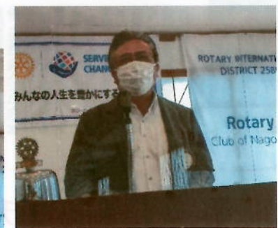
パスト会長の四つのテスト