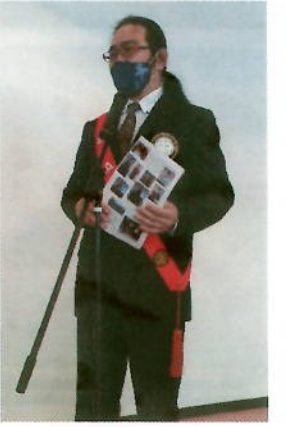
SAA お引き受け ありがとうございます☆