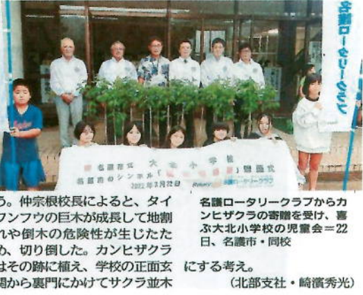
名護ロータリークラブからカンヒザクラの寄贈を受け、喜ぶ大北小学校の児童会(22日、名護市・同校)