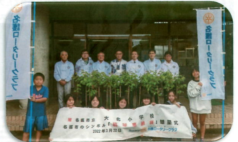
こんなに沢山もらえるとは思わなかった！と喜んで下さった 仲宗根校長先生。異動先の名護小からそっと成長を見守ってくださいね