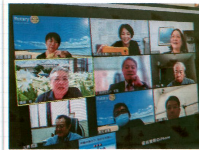
儀保バスト会長の壁紙にはテッポウユリが咲き誇っています☆