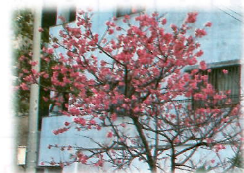
ロータリー花壇を彩る3本のサクラ。今年もありがとう!

さくらの会より寄贈していただいたサクラの苗木2本も植樹しました☆ みんなで成長を見守りましょう!