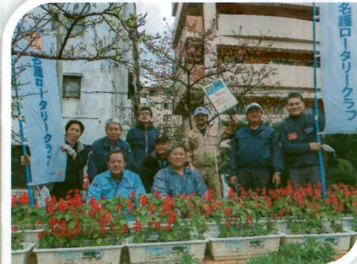
2022. 2. 22(火) ロータリー花壇清掃