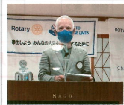
四つのテストは喜世川パスト会長に