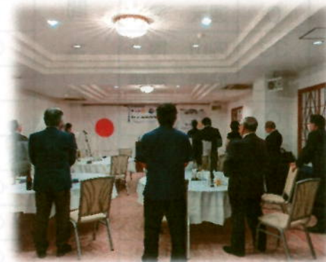
14名の方が集っていただきました☆