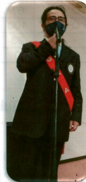
だいぶ板についてきたSAA

10年ぶりに沖縄開催となる地区研修協議会に是非ご参加ください!多くの名護メンバーで次年度の方針を学びましょう!