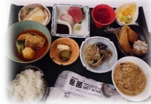
ゆがふいんさんのお食事 嘉陽さんにも絶賛いただきました！

最も強い者が生き残るのではなく、 最も賢い者が生き延びるのでもない。 唯一、生き残るのは変化できる者である。 チャールズ・ダーウィン