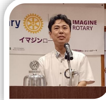
亀島支店長、ご入会 おめでとうございます！