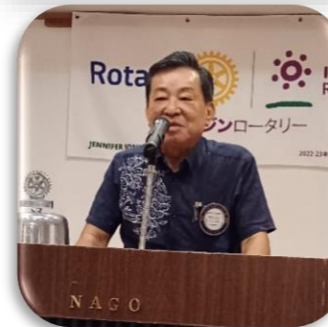
水華での歓迎会も 盛り上がりました！！