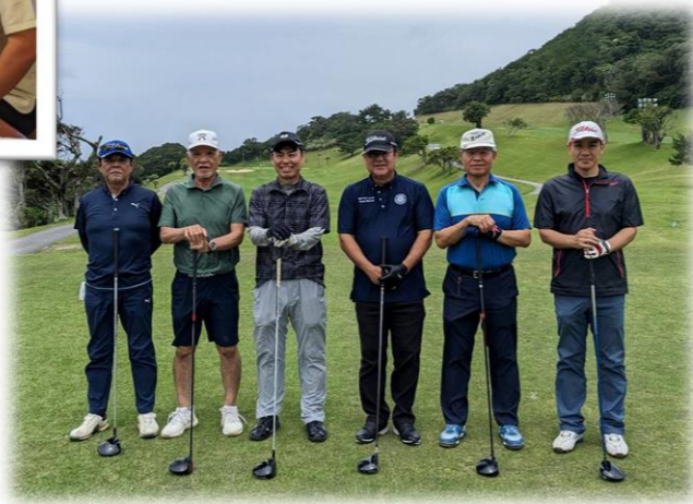
2023.5.31 名護 RC 親睦ゴルフコンペ