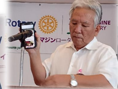
「月桃」聴いてみてくださいね