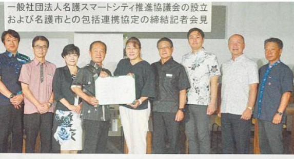
一般社団法人名護スマートシティ推進協議会の設立 および名護市との包括連携協定の締結記者会見