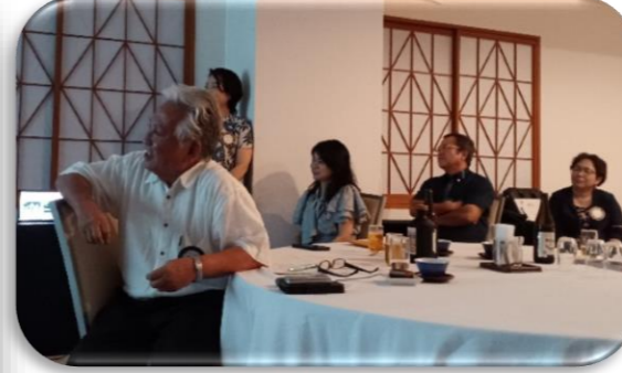
今回も裕子社長が動画を作成して下さいました!