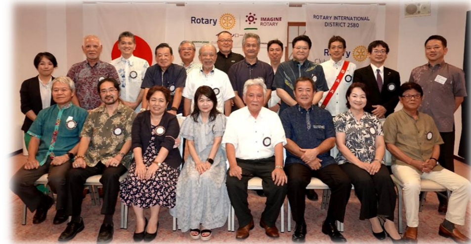
次年度は、透さんが

我等の生業 さまざまなれど 集いて図る心は一つ 求むるところは平和親睦 力むるところは向上奉仕 おおロータリアン 我等の集い