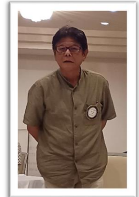
ノミニーとなります。楽しみです!ね!