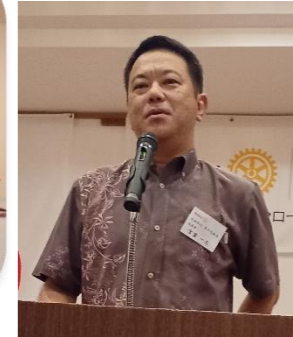
43回大会も🙏よろしく願い