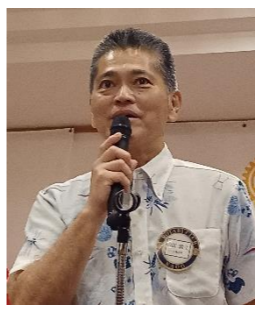
卓話が再スタートとなった年でもありました。プログラム委員長、ご尽力ありがとうございました