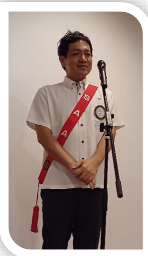
次年度クラブ管理運営委員会小委員会開催もありがとうございました!