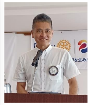
間もなく! 野球大会🏆