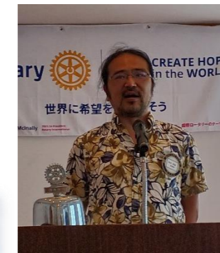
四つのテスト唱和