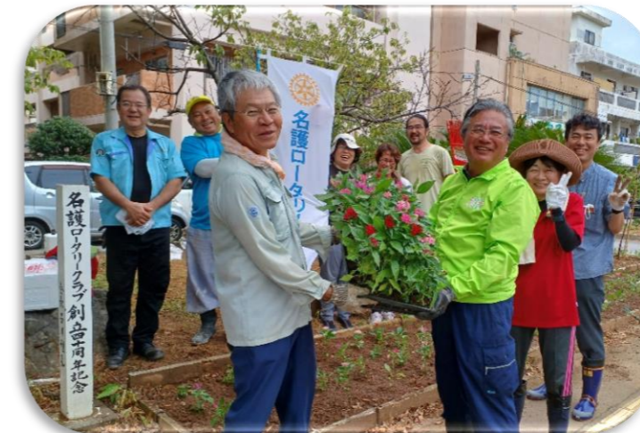
花の里づくりの会から 花苗☆ペンタス☆の苗を320本 寄贈してもらいました!