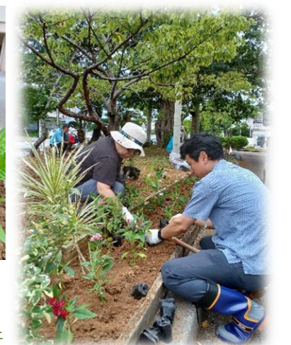
夜間例会前にひと汗流して下さった皆さま、花壇整備へのご協力ありがとうございました。引き続き、皆さまで花壇の水やりの協力もよろしくお願いいたします。