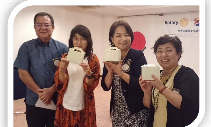
7月生まれの☆パワフル女子☆に、お誕生日ケーキのプレゼントを宮里会長からいただきました(^o^)