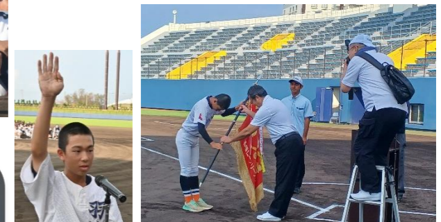
入会早々、大役を果たして下さいました 崎浜支社長。大活躍でした!