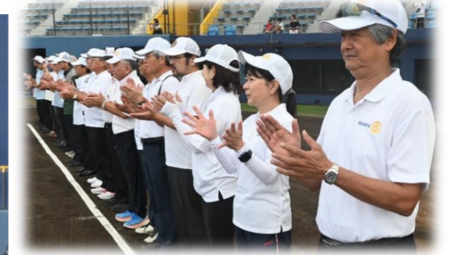
大会初日13名もの皆さまが参加して下さいました