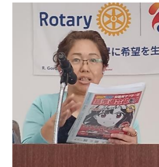
来月は、ガバナー公式訪問。11月はIMと 皆さまのご協力をお願いします!