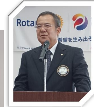
地区大会へのご出席、皆さま お願いいたします