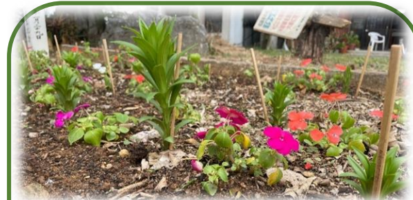
ロータリー花壇のテッポウユリ、早くも芽を出し伸びてきました！きっと開花もあつという間ですね。楽しみです♪ 2023年12月6日

2023 年 最終例会にて 名護 RC 年次総会を開催いたします。 令和5年 12月 20日(水) 19:00~21:00 場所:ホテルゆがふいんおきなわ3F ハピラ ※当日やむなく欠席される方は 12/18(月)までに委任状の提出をお願いいたします