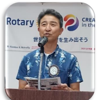
四つのテスト唱和のデビュー を飾っていただきました！