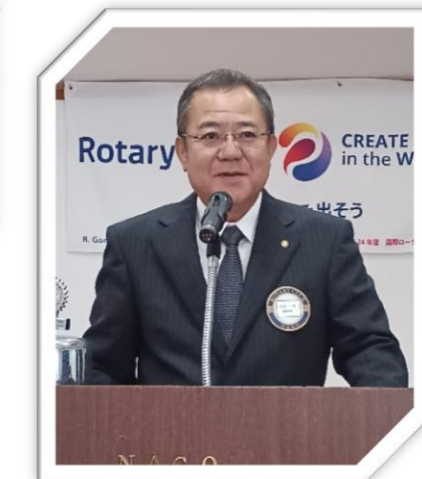
年次総会では 2024-25 年度 理事の選出を行います