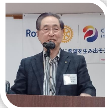
国際ロータリー第2510地区