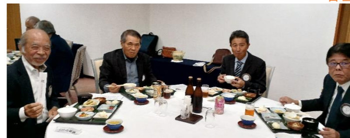
敏夫先生、ご参加ありがとうございます

出席18名/欠席14名 出席率 56.25% ニコニコボックス累計 162,422 円