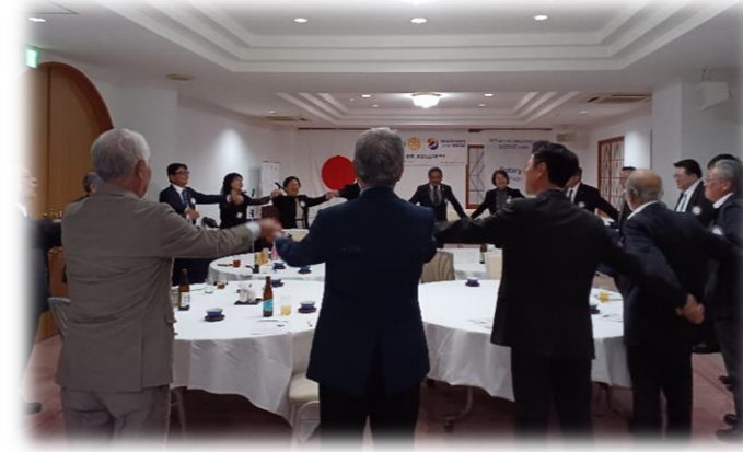
会の終わりに輪になり「手に手つないで」を大合唱♪