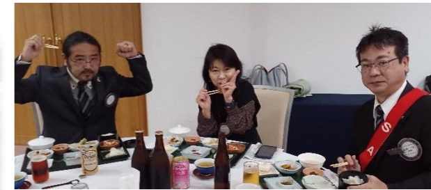
福谷副幹事は先週石垣 RC をメークアップされ、石垣のパワーに感化されお戻りになりました