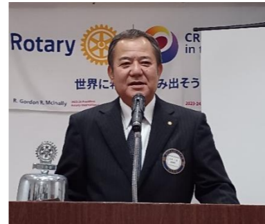
上期、あっという間…でした！