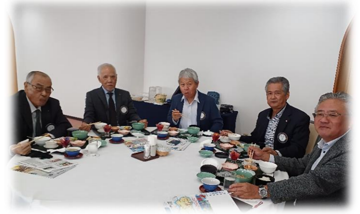
毎週、和やかにお食事を楽しまれつつ情報交換♪