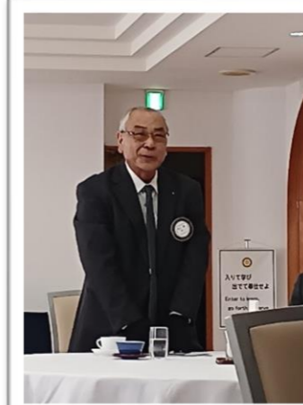
今年はぜひ良い年にしたい！ と、ご挨拶いただきました