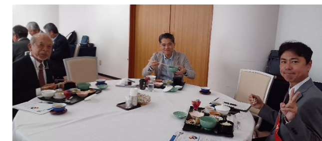
SAAのご協力、いつもありがとうございます☆