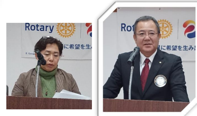
週末には名護さくら祭り！皆さん楽しみましょう