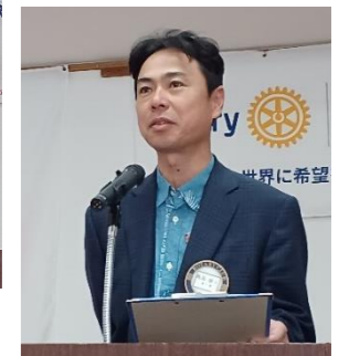
亀島副委員長による出席報告