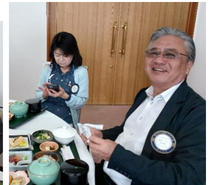
運天さん 久しぶりのご参加、ありがとうございます!