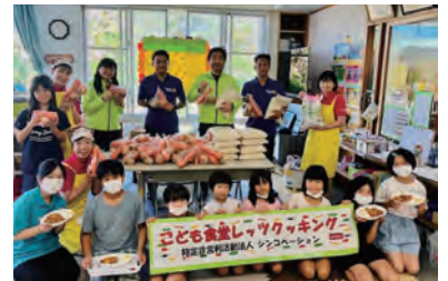
こども食堂への食糧支援

今年度は、3 月 24 日に (一社) タコライスラバーズさんと協働で、牧志公園にて小学生の子ども達にタコライスを無料配布。同時に本事業の