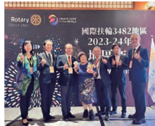
日本から出席の皆さん