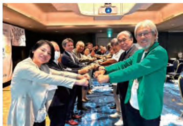
那覇東 RC 名物の好意と友情の『ゲータッチ』

例会場は、沖縄観光のシンボルとも言える国際通りのど真ん中に位置するホテル コレクティブ。仕事や観光で来沖された際に参加し