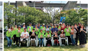
地区補助金活用事業