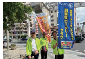
のぼり旗を手に呼びかけ (国際通り)

目的である独自作成した「はらぺこキッズレスキューブック」(那覇エリア小学校校区別みらいチケット協力店 MAP) を配布致しました。