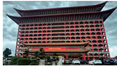
地区大会会場・圓山大飯店