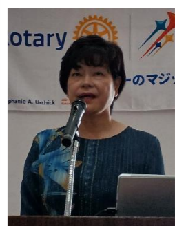
貴子職業奉仕委員長

今月の夜間例会は、開催を 18:30~19:30 に変更し、宜野湾 RC と合同夜間例会を行います 皆さま、ご参加お願いいたします!