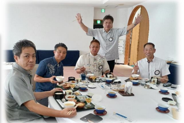
運天さん、久しぶりのご参加 ありがとうございます