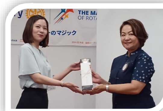
毎回 SAA ドキドキします、と仰る金城委員長♪

第3回理事会と卓話にりゅうぎん総合研究所を招いての例会を行いました。どなたもお忙しいお仕事の時間を割いての例会への参加に、この貴重な1時間をどのようにするか、ご自身はどのように活かされるか。運営側も毎回知恵を絞られています。多くの会員に参加してもらい、楽しく繋がってほしい!の会長テーマの下、どうせやるなら明るく楽しくやると、会長には人一倍明るい笑顔で会を締め上げて頂きました。