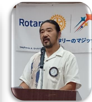
前年度、会長と共に RLI を受講された福谷幹事