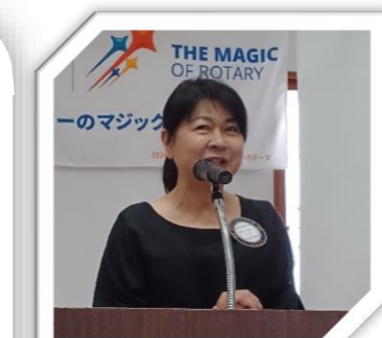
地区米山奨学委員会主催