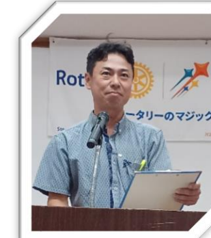
亀島委員長による出席報告