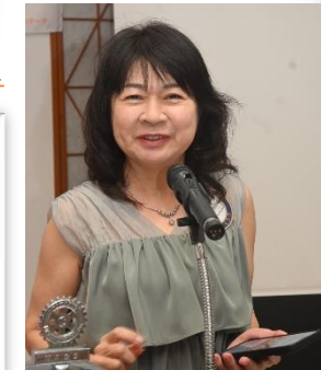
3年目の米山奨学委員も しっかり務められています。