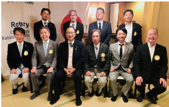
9月18日東京葛飾東 RC 公式訪問にて

先月はルーブル美術館の「カナの婚礼」のことを書きましたが、その後の公式訪問で、聖書持参でお出迎え頂いた会長さんがいたのには感激しました。さて、ガバナー公式訪問を重ねています。そのクラブには、どのような方が在籍しているのか。訪問前に会員名簿に目を通します。皆さんの職業はそれぞれですが、資格をお持ちの方が散見されます。税理士、医師、弁護士、会計士、等々。中には45歳で社労士の資格をお取りになった方もいました。皆さん、勉強を重ね合格なさったのでしょうか。一方この僕はというと、大した資格は何も持っておりません。せいぜい運転免許ぐらいです。