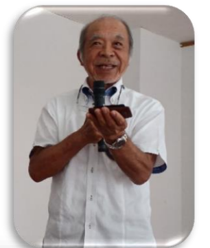
出席報告の儀間 委員ご指名で