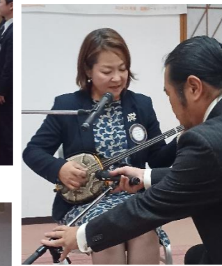
裕子会長の三線で みんなで安里屋ユンタ♪