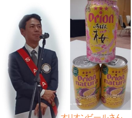
オリオンビールさん ありがとうございます！