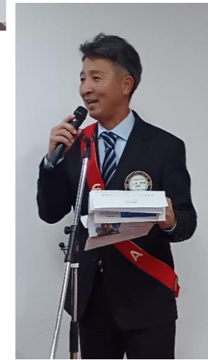
運天委員長・山本副委員長、お疲れさまでした。