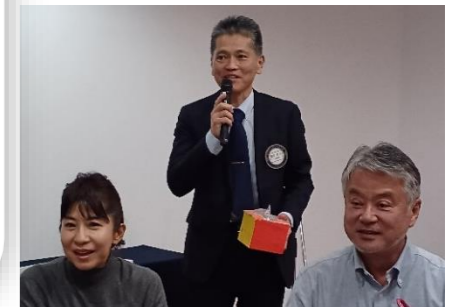
お楽しみ抽選会は、洋介エレクトと儀間副幹事が