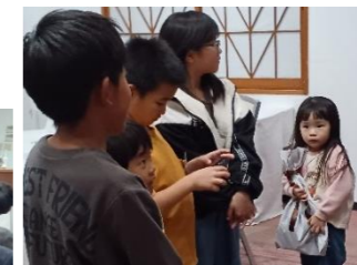
今年も子どもたちにプレゼントを用意しました