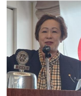
侑奈さんのカウンセラーを