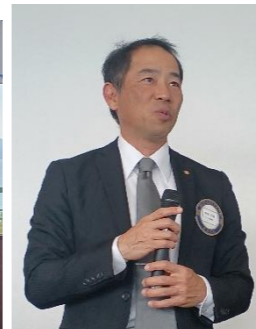
久しぶりに会員の皆さまにテーブルスピーチをお願いし、各々今日感じたこと等をお話し頂きました。とても良い機会でしたね！