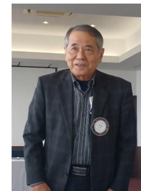
敏夫先生のご参加も久しぶりでした♪