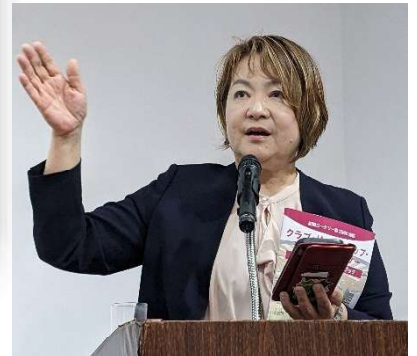
ロータリー財団の部門会議にご参加頂きました