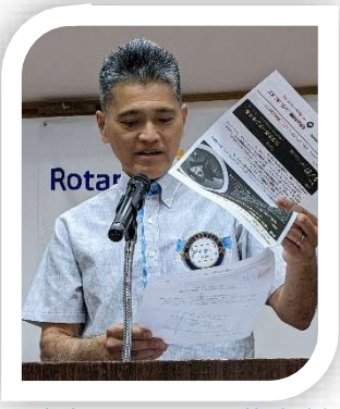
今年度中にロータリー花壇清掃も予定しています