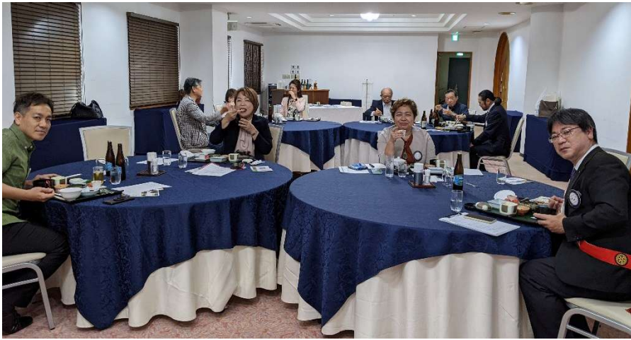
GW 前、参加の方は少なめな夜間例会でした