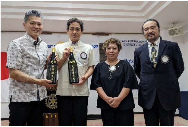
大城会長・儀間幹事 1年間本当にお疲れさまでした

新城エレクトへと引き継がれましたが、会長は次年度のお役目で更にクラブに貢献することで、今年度の成長を確実なものにしたい、とご挨拶されました。お酒コンビのお二人、本当にありがとうございました！