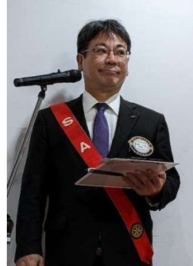
SAA 委員長、一年間お疲れさまでございました