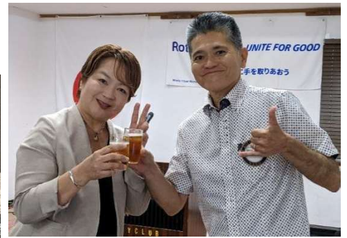
新年会や移動例会でもオリオンビールからの奇贈をありがとうございました