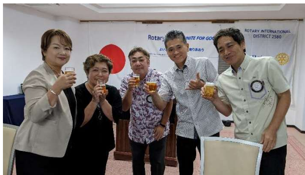
1年間 皆さま、本当にありがとうございました