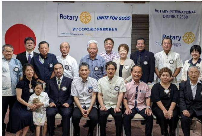
ニコニコボックスにも沢山の皆さまが協力して下さいました！