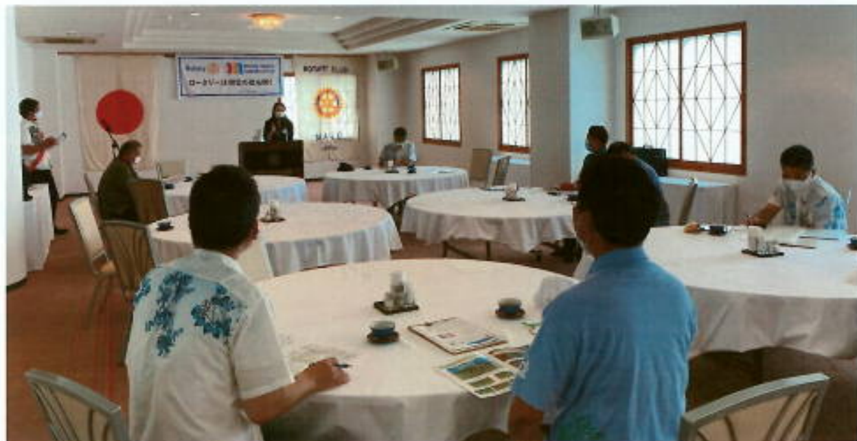
参加会員11名の時短定例会幹事報告の様子