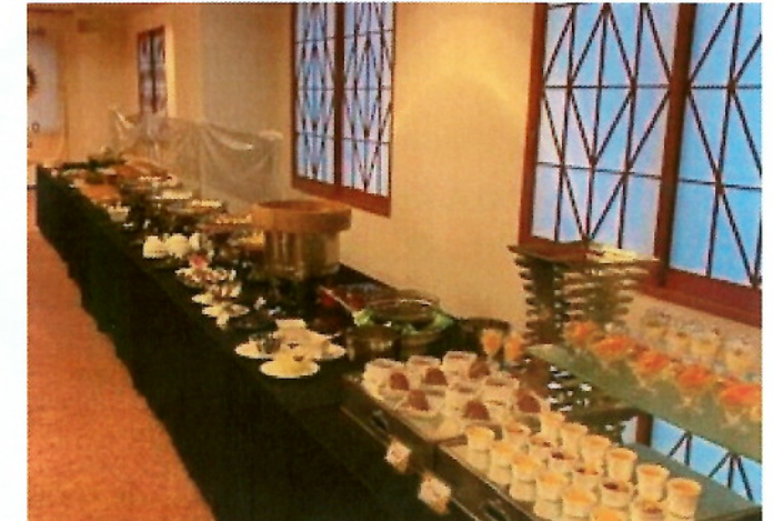
美味しい食事を楽しみながら(ビュッフェ)