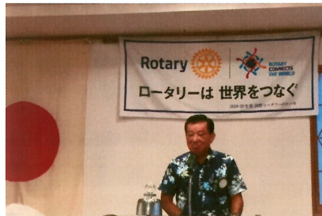
『2019-20 年度 奥本ガバナーあいさつ』