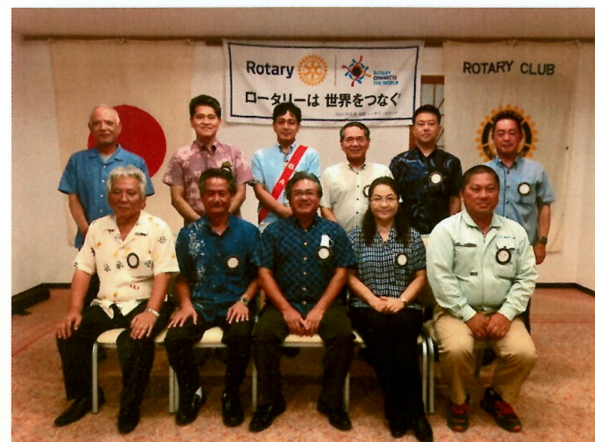
2020-21 年度 理事のみんなで記念撮影