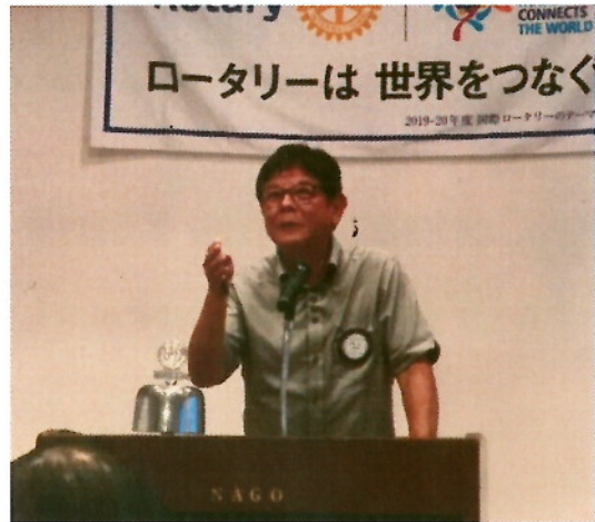
『2019-20 年度 宮城幹事あいさつ』