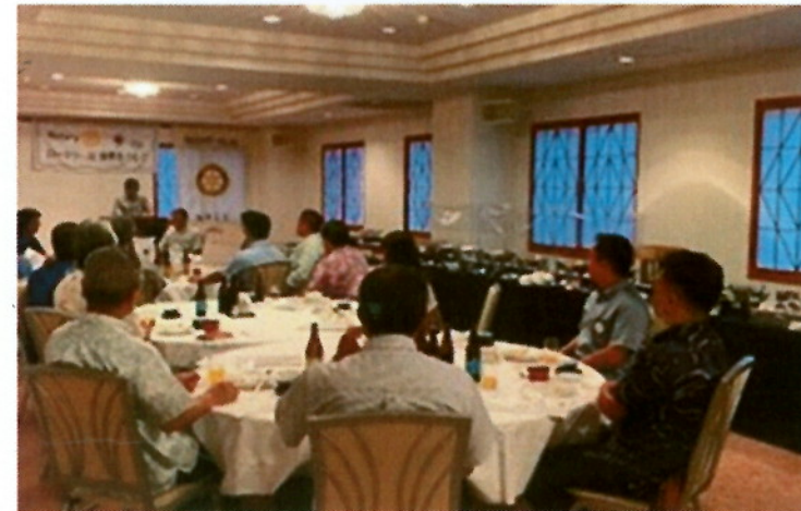
比嘉会長年度 最後の定例会