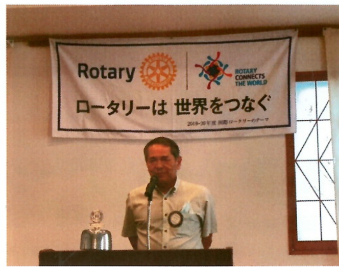
『2019-20 年度 比嘉会長あいさつ』