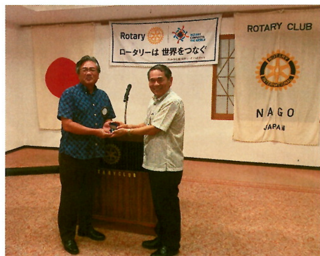
『比嘉会長より儀保エレクト会長バッジの引継ぎ式』