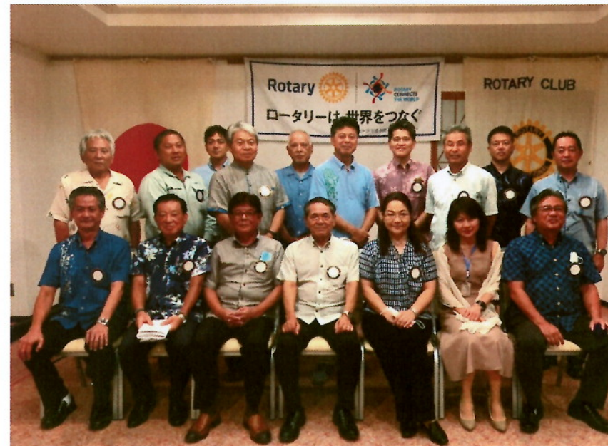
参加者みんなで記念撮影