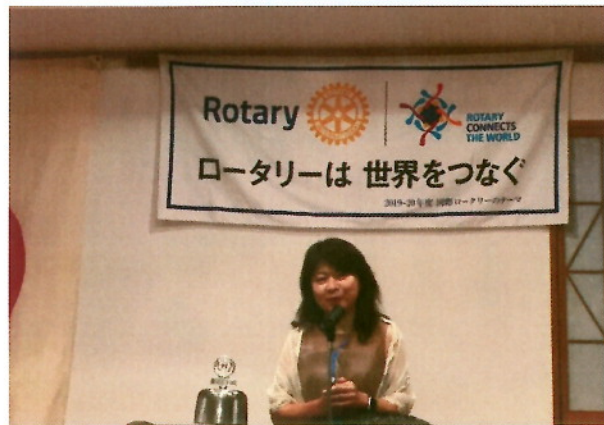
『2019-20 年度 町田分区幹事あいさつ』