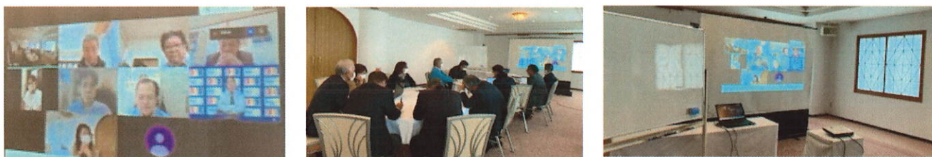
↑名護RC初のオンラインと現地参加のハイブリッド形式で、IM全体会議を開催しました。(2021年1月29日)

来る3月16日(火)開催を予定していたIMについて、新型コロナウイルス感染症拡大防止の観点と、皆様の安全を第一に考慮し、中止となりました。