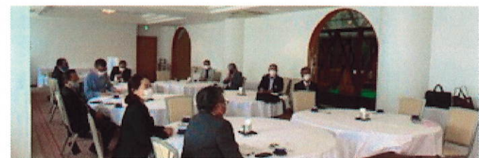
阪神・淡路大震災26年目を目前に、命の大切さを再認識する貴重な体験談を伺うことができました。震災で犠牲となったみなさまのご冥福を心よりお祈り申し上げます。合掌