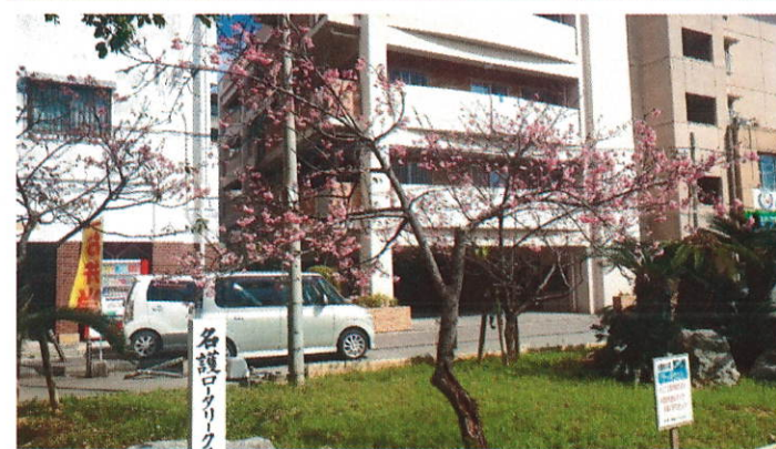
↑ ロータリー花壇の桜も満開! (岸本 直也 会員提供)

→ 名護城の名護青少年の家Bコース付近、リュウキュウカンヒザクラの木の幹がハート形になっている。発見したのは儀保会長! (沖縄タイムス記事より)