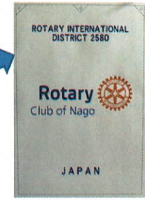
↑ 劣化が著しかった為、第2580地区推奨デザインで新調しました。